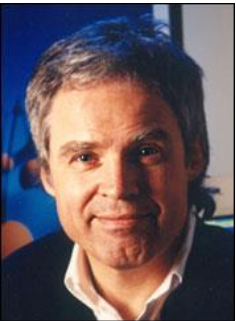
Horst Störmer, Nobelpreis für Physik