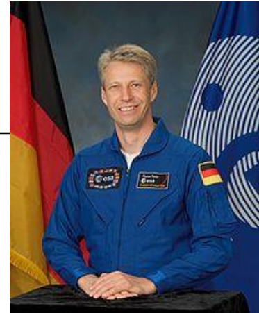
Thomas Reiter, Astronaut und ESA-Direktor